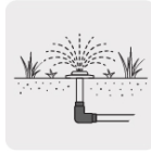
Para sistemas de riego y jardín