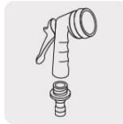
Pistolas para riego