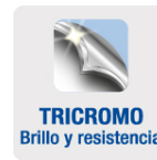
TRICROMO Brillo y resistencia