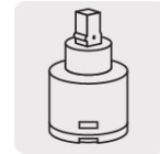
Cartucho cerámico (CARMO-2)