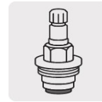
Cartucho de compresión (CARCO-1)