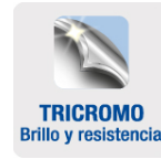
TRICROMO Brillo y resistencia