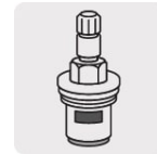
Cartucho cerámico 90° (CARCE-7)