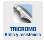
TRICROMO Brillo y resistencia