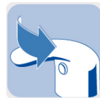
1/4 de vuelta