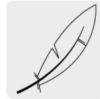
Pluma y plumón de ganso