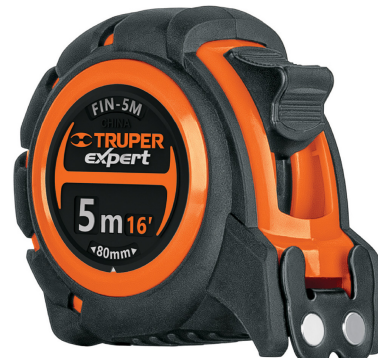
Gancho doble magnético