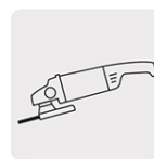
Para esmeriladora angular