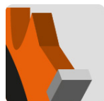
Dientes de carburo