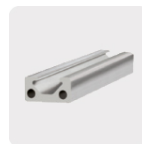
Metal no ferroso