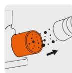
Puerto para extracción