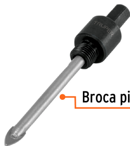
Broca piloto de 1/4"