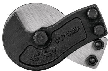
Cuchillas de acero al cromo vanadio en forma de gancho