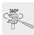
Base con giro horizontal