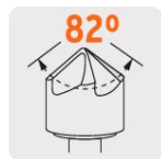
Ángulo de punta