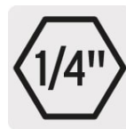
Zanco hexagonal de cambio rápido