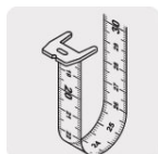
Cinta impresa por ambos lados