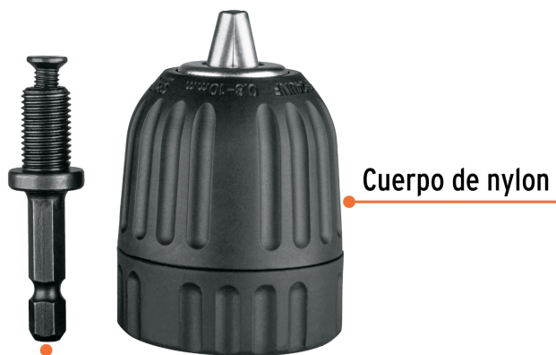
Cuerpo de nylon