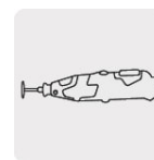
Para herramienta rotativa