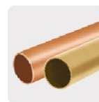
Metales no ferrosos (cobre y latón)