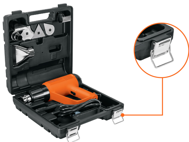
Estuche con broches metálicos