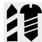
Taladro y destornillador