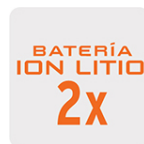
Más tiempo de vida Mayor velocidad de carga