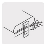
Clip para cinturón