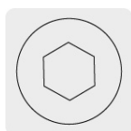
Entrada para llave allen