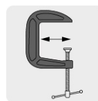
Yunque más profundo