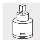
Cartucho cerámico (CARMO-20)