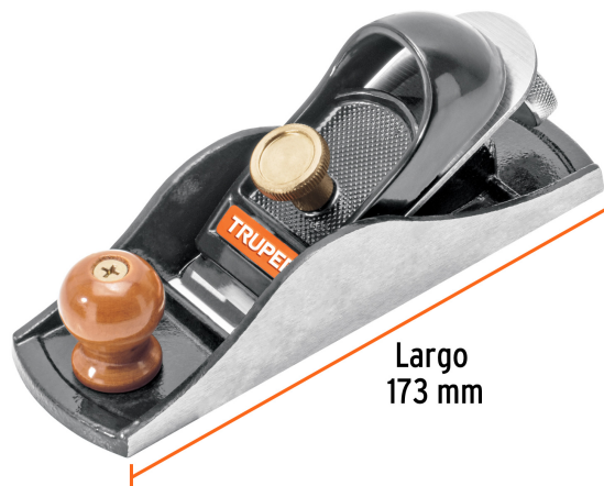
Largo 173 mm