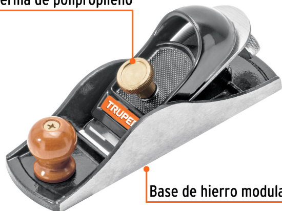
Base de hierro modular