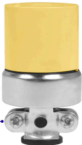
Abrazadera de acero