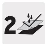
Capa de material PVC / Poliéster