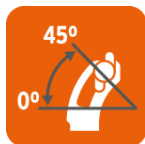
Capacidad de biselado