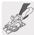
Operación con una sola mano