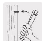
Movimiento tipo martillo