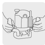
Operación a dos manos