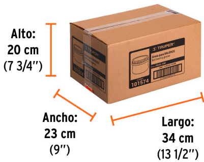
Contiene: 3 inner (12 piezas)