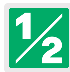
Impulso de cuadro con pasador retenedor