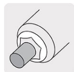
Bornes con conector rápido