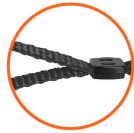
Correa de tela