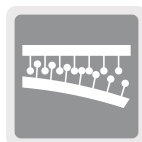
Sistema de fijación hook and loop