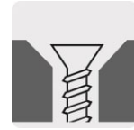
Ayuda a ocultar la cabeza del tornillo