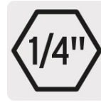
Zanco hexagonal de cambio rápido