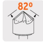
Ángulo de punta