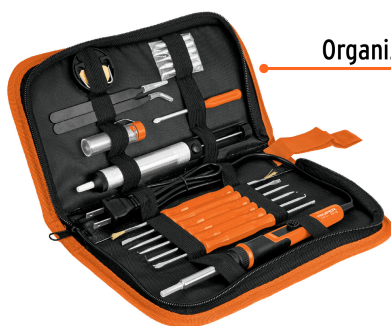
Organizador de PVC

Temperatura regulable de 200° C a 450° C