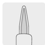
Cautín con punta cubierta de hierro y estaño