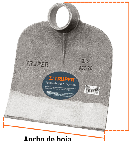
Altura de hoja 8 1/2" (22 cm)