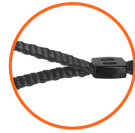
Correa de tela