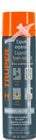
Lata de 500 ml