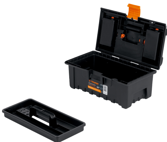
Incluye charola para herramienta pequeña