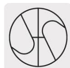
Punta Split Point