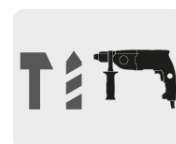
Para rotomartillos SDS Plus