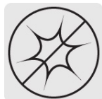
Acero latonado (anti-chispa)