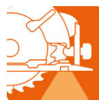
LED para iluminar