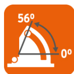
Capacidad de biselado