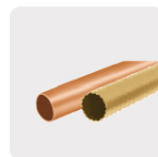
Metales no ferrosos (cobre y latón)