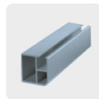
Metal no ferroso