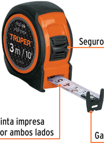
Cinta impresa por ambos lados