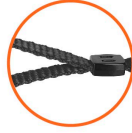
Correa de tela