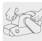
Operación a dos manos