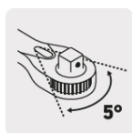
Mecanismo de 72 dientes